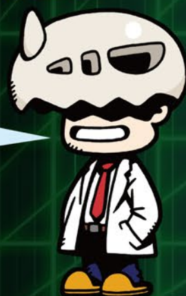
ほねほねザウルス博士 Dr.ヨッシー

ほねほねザウルス40弾もしくは グレートほねほねザウルスを 買うとついてくる、 20周年記念のスペシャルカード! なんと、カードバトルもできるんだ!