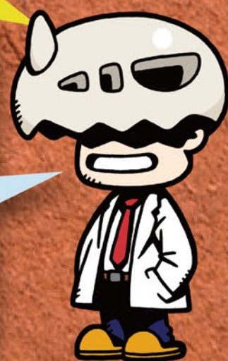
ほねほねザウルス博士 Dr.ヨッシー

いつも「ほねほねザウルス スペシャルサイト」に すてきな作品をいっぱい投稿してくれてありがとう! 毎月5作品が選ばれる「ヨッシー賞」を受賞するには!? そのためのコツをちょっと紹介するよ!