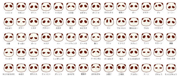
ぱんだの顔は70種類

「さくさくぱんだ」は1996年に誕生し、販売開始より25年を超えるロングセラー商品です。現在は“幸せみつけた、癒しのぱんだ”をコンセプトに、レギュラー商品、期間限定商品、ファミリーパック商品を展開しています。どの商品もチョコレートの“ぱんだ”の顔は70種類あり、さくさくのビスケットと二種類のチョコを組み合わせたこだわりの味わい