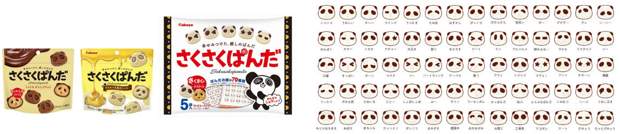
ぱんだの顔は70種類

「さくさくぱんだ」は1996年に誕生し、販売開始より25年を超えるロングセラー商品です。現在は“幸せみつけた、癒しのぱんだ”をコンセプトに、レギュラー商品、期間限定商品、ファミリーパック商品を展開しています。どの商品もチョコレートの“ぱんだ”の顔は70種類あり、さくさくのビスケットと二種類のチョコを組み合わせたこだわりの味わいだけでなく、様々なかわいい“ぱんだ”の表情を、食べる度に楽しむことができます※。 ※1商品中に70種類全てが入っているわけではありません。