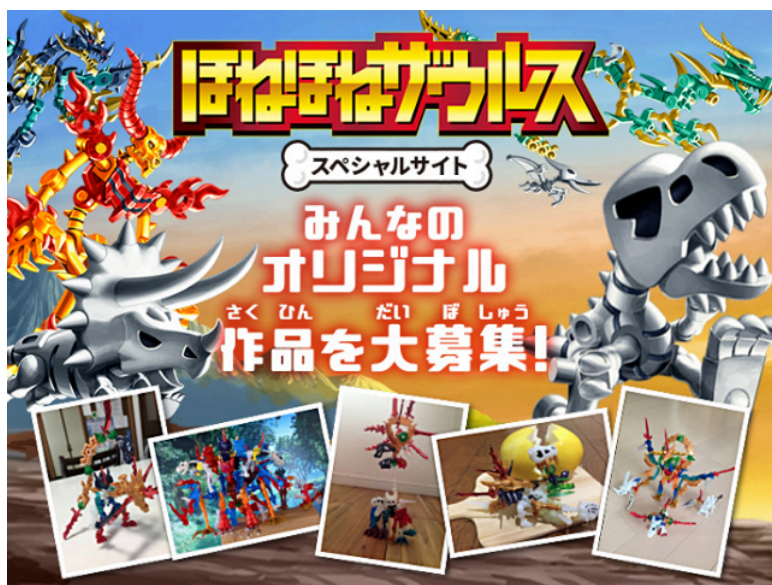
「ほねほねザウルス」スペシャルサイト