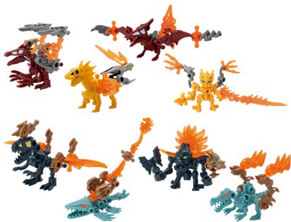
現在販売中の「ほねほねザウルス」(44弾)