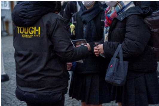
今年の共通テストの噛み応え（難易度）は？

加えて、試験を終えた受験生たちに、「共通テストの“噛み応え”アンケート」を実施。 試験の難しさ（＝噛み応え）について聞いたところ、64.9%の人が「とても噛み応えがあった（難しかった）」「噛み応えがあった」と回答しました。また53.7%が例年SNSでも話題になっているような珍問題＝“咀嚼したい”問題も出題されたと感じているようです。